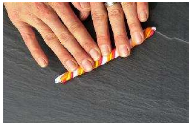
Nun rolle die Wurst mit beiden Händen fest...