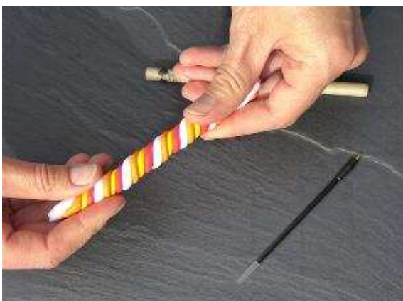
...bis ein Streifenmuster wie hier entstanden ist.