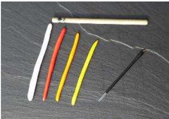
... etwa gleich lange Würste