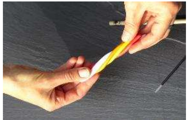
Diese werden anschließend miteinander verdreht...