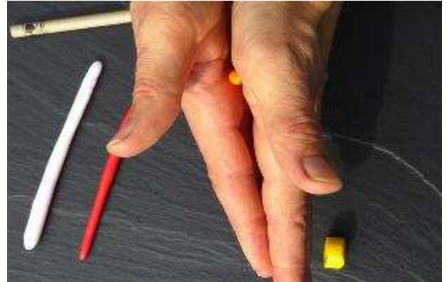
Forme aus jeder einzelnen Farbe...